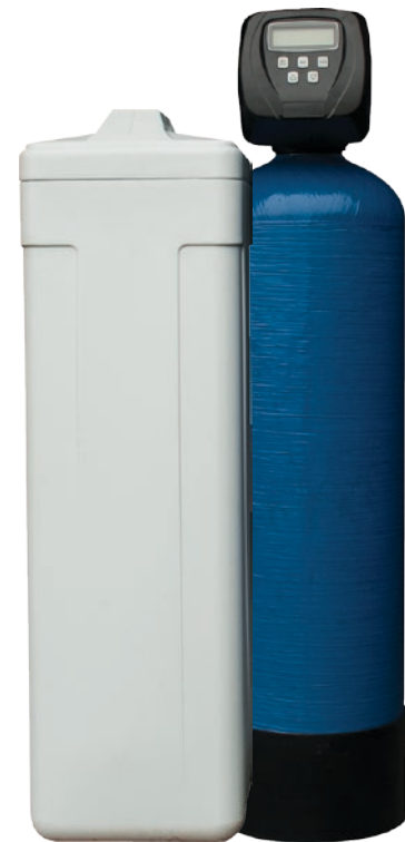
Humusfilter med salttank