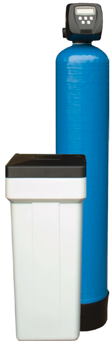
Kombinationsfilter med salttank

Därefter väljer vi tillsammans ett filter som har rätt mängd filtermassa då detta bestämmer hur ofta filtret ska regenereras, vilket förbrukar salt.