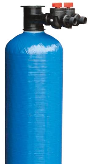
Avsyrningsfilter Modell KF