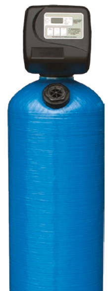
Avsyrningsfilter Modell KA